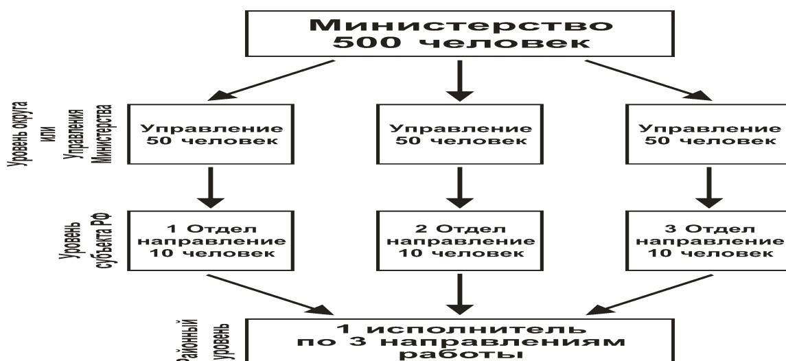
Рисунок № 3

Допустим в каком-либо государственном учреждении на районном уровне имеется исполнитель по трем направлениям работы. Над ним на уровне города (хотя возможно встраивание еще дополнительных уровней) имеется уже три отдела по соответствующему направлению, где в каждом отделе трудится по 10 человек. И каждый из отдела, показывая свою работу, шлет соответствующую бумагу исполнителю на низовом уровне. На уровне региона имеется уже целое управление, где по каждому направлению «трудится» уже 50 человек. Над регионами есть округа, далее Москва, управление в самом министерстве и само министерство. На рисунке мы заметно упростили данную схему. Самое главное в ней то, что все пишут бумаги по исполнению в нижестоящие звенья. В итоге самому исполнителю уже «прилетает» огромное количество бумаг. Плюс еще ему нужно как-то успевать выполнять и свою непосредственную работу, которая порой «тупо» копируется с федеральных инструкций без учета мнения региона и конкретных исполнителей. Изменить данную систему никто не может. Кроме того, к низовым исполнителям и его вышестоящим органам в регионы приезжают проверяющие, которые следят за тем, чтобы «спущенные сверху» бумаги вышестоящих инстанций исполнялись качественно и в срок. По результатам проверок проверяющие докладывают своим руководителям (вплоть до Министра, в зависимости от