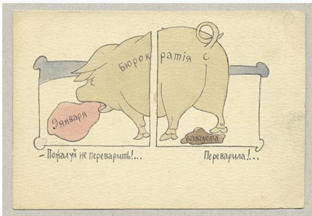
Открытка начала XX века В. Каррика с карикатурой на российскую бюрократию.

Корни современной российской бюрократии начались с перестройки. В СССР бумаги были, но, разумеется, не в таком объеме. Там были другие проблем, например под названием «Госплан», но это отдельная тема исследования. Так вот именно с перестройки во власти, в том числе в исполнительной, стали появляться люди, которые хотели показать свою работу. Вот они ее и показывали, требуя написания сначала планов работы. Потом предплановых мероприятий. Потом отчетов, отчетов на первый отчет, на второй, на третий и т.п. С развалом Союза бюрократия в России опять же с целью централизации власти и «поджимания» под Москву всей России стала набирать свои обороты.